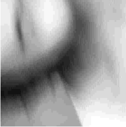
© Luciana Fina - vídeos de MOVEMENT portraits